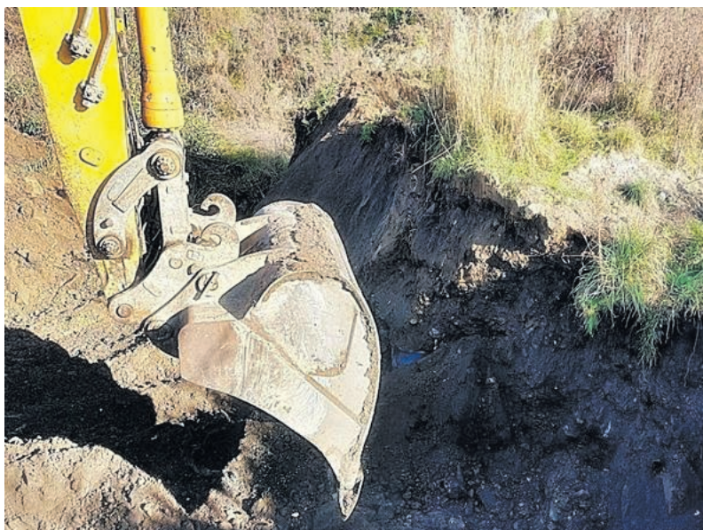
W Bieruniu znaleziono zakopane w ziemi beczki z chemikaliami...