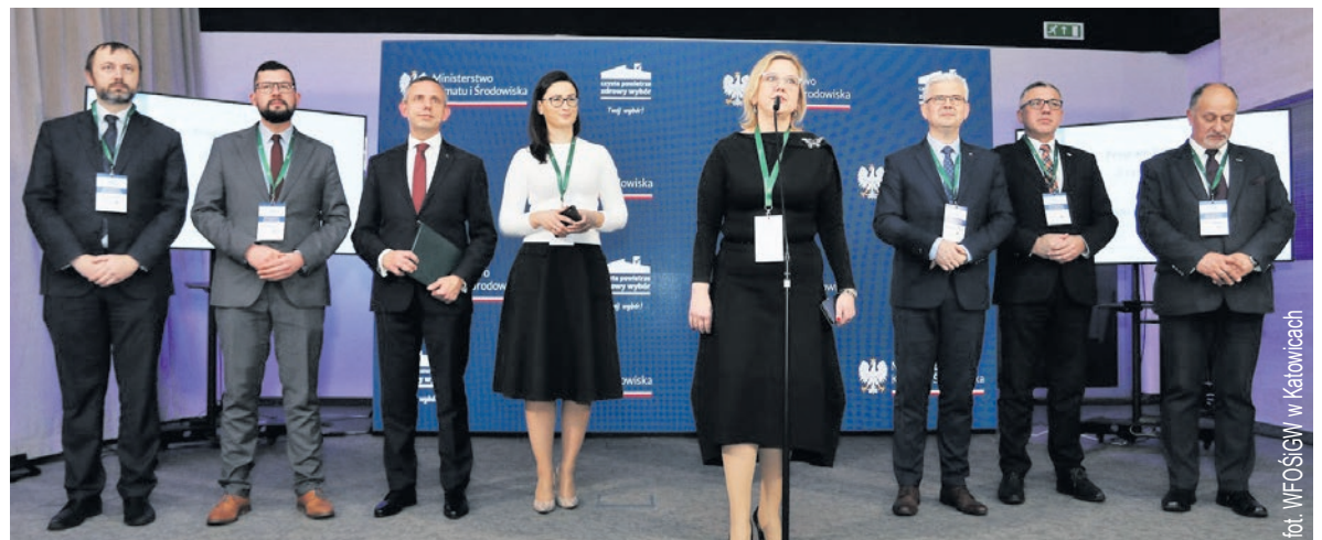
fol. WFOŚiGW w Katowicach

Minister Klimatu i Środowiska Anna Moskwa podała, że po zmianach w programie „Czyste Powietrze” przy podwyż-