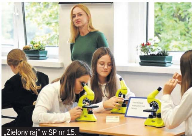
„Zielony raj” w SP nr 15.