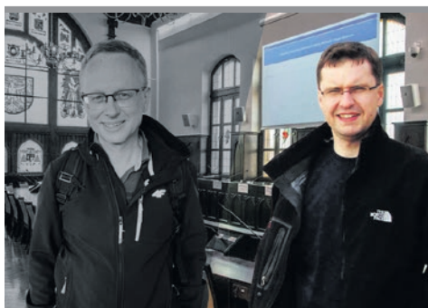
Trzęsienie ziemi w Radzie Miasta!