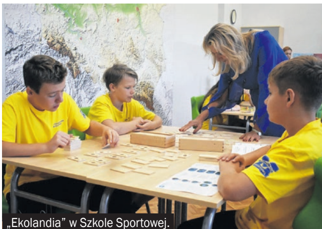
„Ekolandia” w Szkole Sportowej.