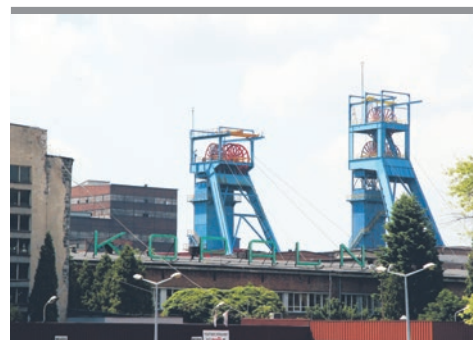
Z górnictwem źle? Bez górnictwa jeszcze gorzej!