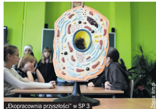
„Ekopracownia przyszłości” w SP 3