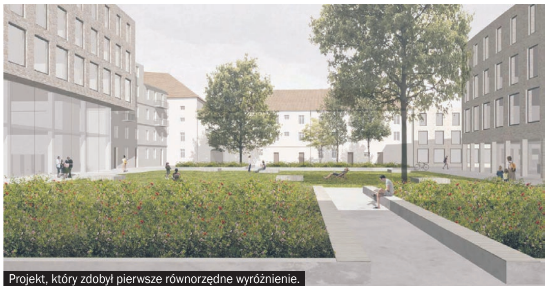
Projekt, który zdobył pierwsze równorzędne wyróżnienie.