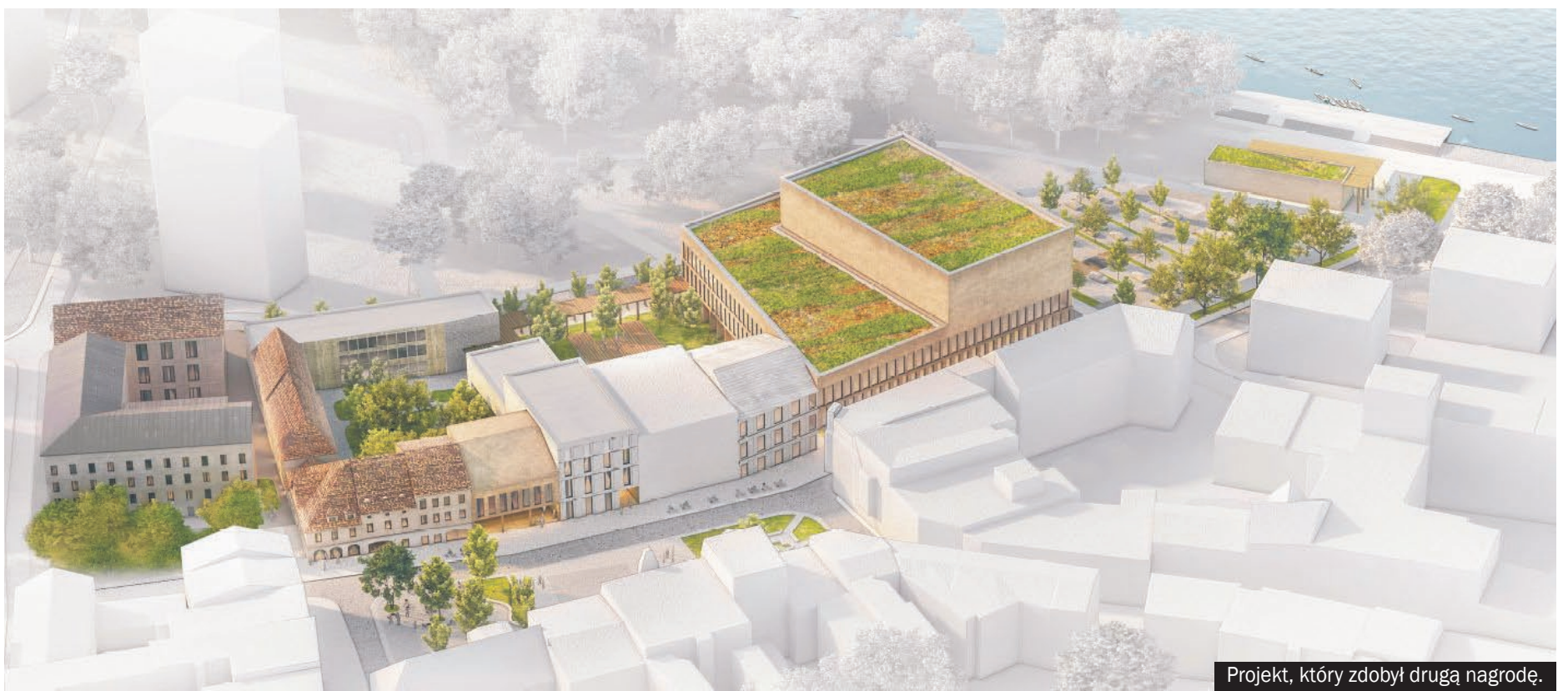
Projekt, który zdobył drugą nagrodę.