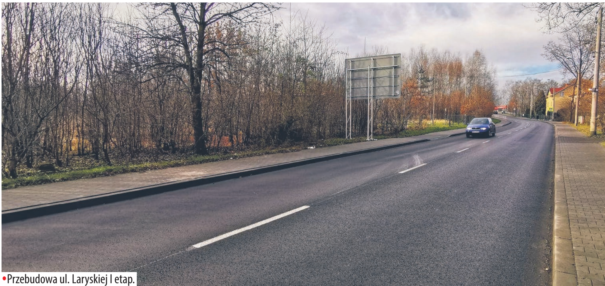
•Przebudowa ul. Laryskiej I etap.

Raport z działań inwestycyjnych w latach 2019-2021 przy wsparciu