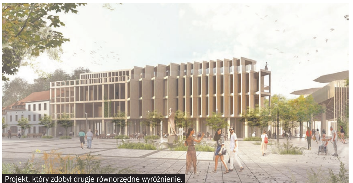
Projekt, który zdobył drugie równorzędne wyróżnienie.