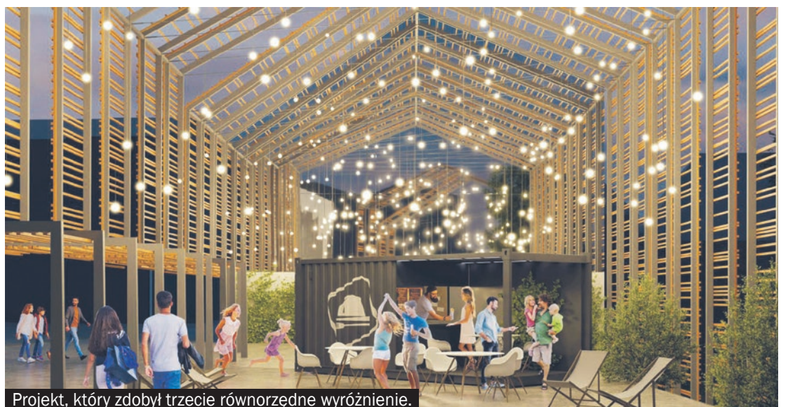
Projekt, który zdobył trzecie równorzędne wyróżnienie.