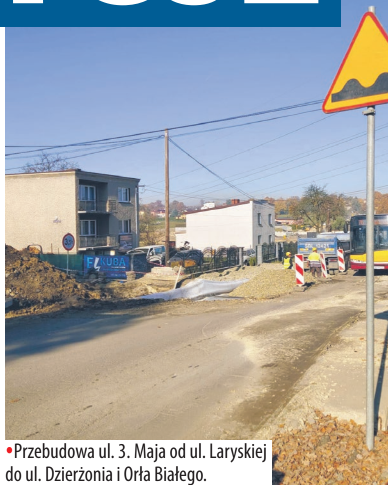
•Przebudowa ul. 3. Maja od ul. Laryskiej do ul. Dzierżonia i Orła Białego.