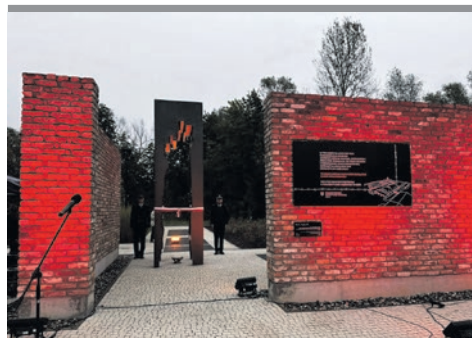
Wyjątkowe miejsce pamięci na Promenadzie.