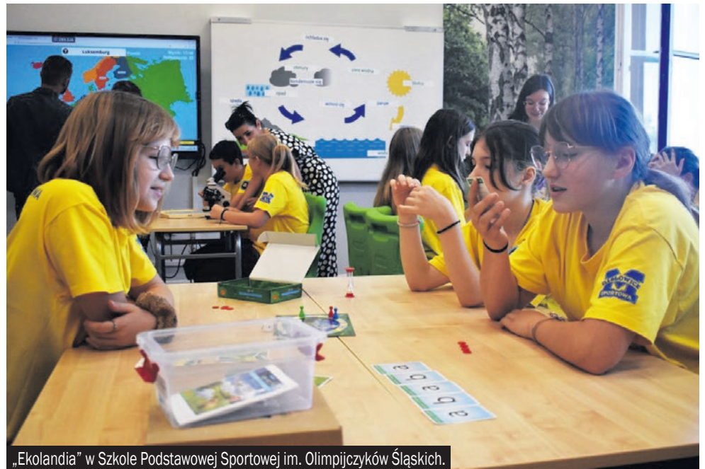
„Ekolandia” w Szkole Podstawowej Sportowej im. Olimpijczyków Śląskich.

Szkoła sportowa to kolejna placówka w naszym mieście, która zyskała nową pracownię przyrodniczo-geograficzną „Ekolandia”. W nowej klasie uczniowie będą zgłębiać tajniki geografii i przyrody.