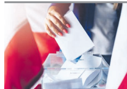
I po wyborach...