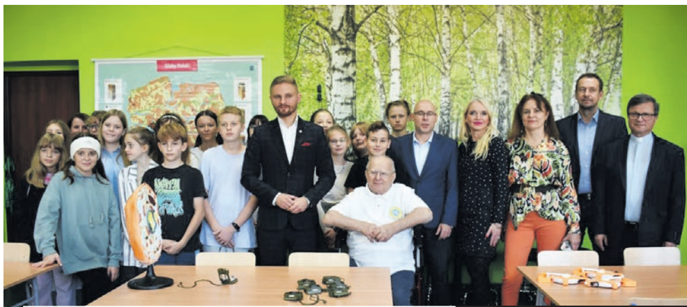
„Ekopracownia przyszłości” w Szkole Podstawowej nr 3 im. Kawalerów Orderu Uśmiechu