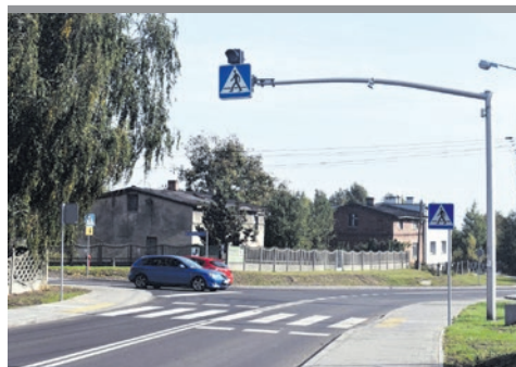
Laryska jak nowa!

Ogromna inwestycja na Piasku uruchomi potencjał strefy inwestycyjnej, która powstanie na terenach byłej kopalni Mysłówice.