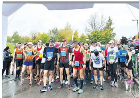
Deszcz nie przestraszył biegaczy.