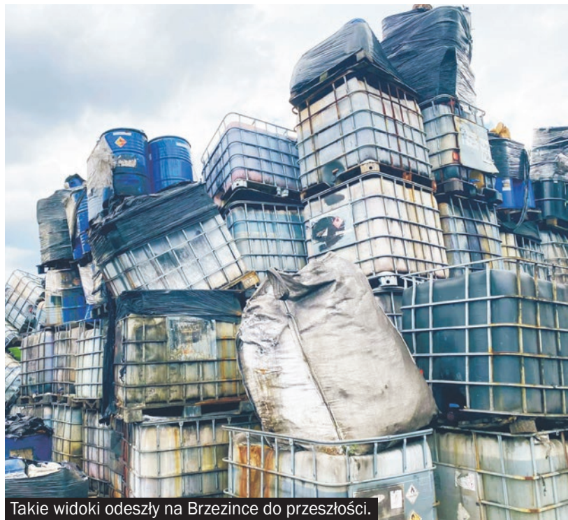
Takie widoki odeszły na Brzezince do przeszłości.

► W chwili oddawania gazety do druku ze składowiska toksycznych odpadów wywieziono ponad 8 tys. chemikaliów. Do usunięcia pozostało już tylko 200 kilogramów.