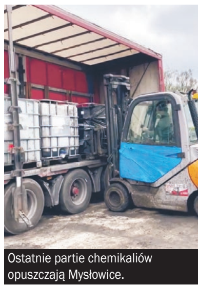
Ostatnie partie chemikaliów opuszczają Mysłowice.

Mieszkańcy Brzezinki i całego miasta mogą już odetchnąć z ulgą, ponieważ nie grozi im już bezpośrednio, fizyczne zagrożenie, ale problem nie zniknął do końca. Instytucje odpowiedzialne za ochronę środowiska muszą teraz ustalić czy doszło do skażenia wód gruntowych i gleby.