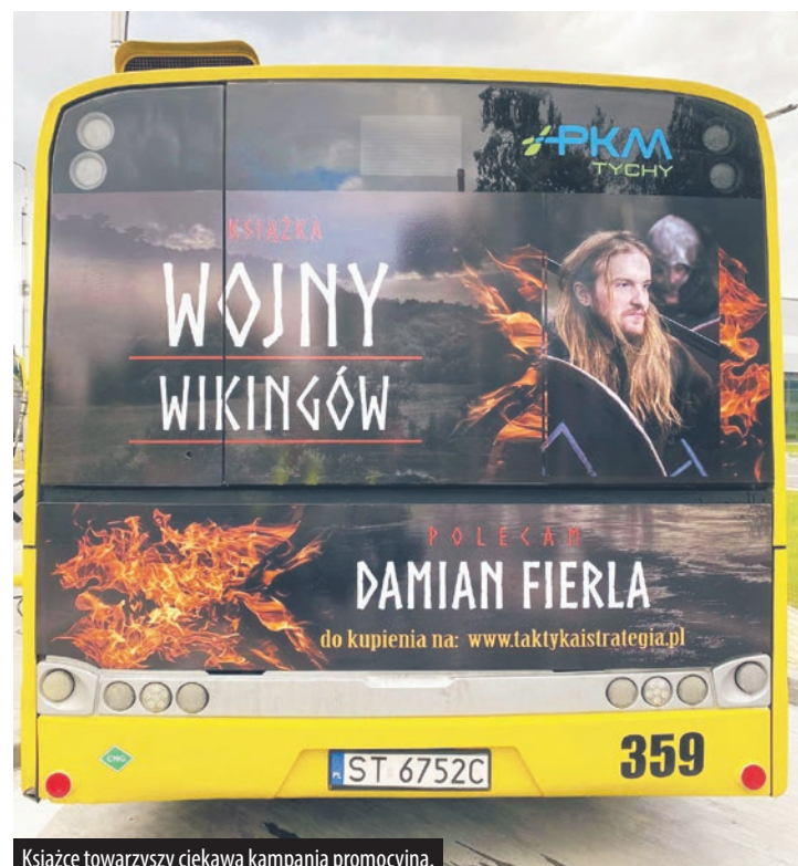
Książce towarzyszy ciekawa kampania promocyjna.

Północą a Południem kontynentu. Państwo Mieszka I i Bolesława Chrobrego na szeroką skalę prowadziło wymianę handlową z Wikingami ze Szwecji i Danii. Drużyny wojów pierwszych polskich