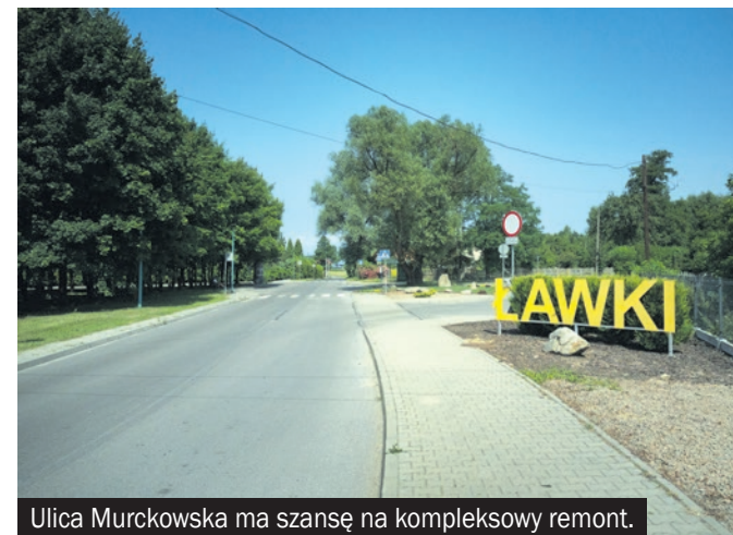
Ulica Murckowska ma szansę na kompleksowy remont.