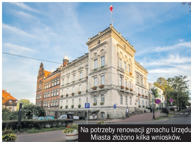
Na potrzeby renowacji gmachu Urzędu Miasta złożono kilka wniosków.