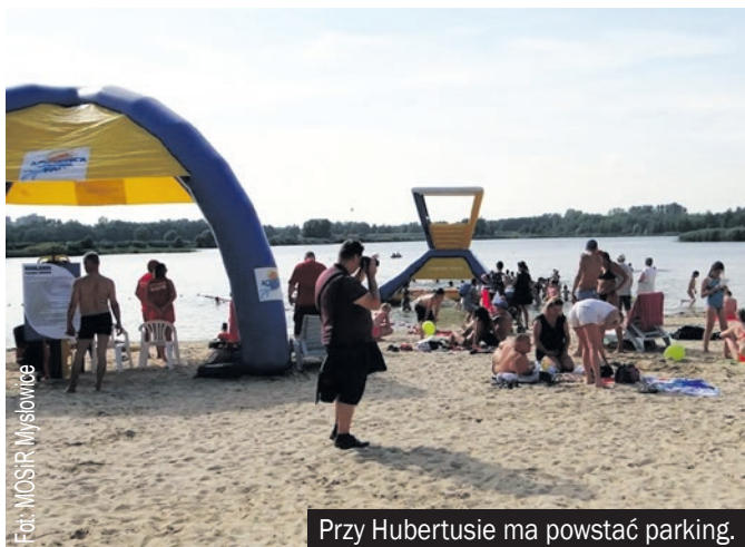
Przy Hubertusie ma powstać parking.