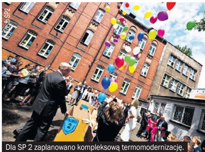
Dla SP 2 zaplanowano kompleksową termomodernizację.