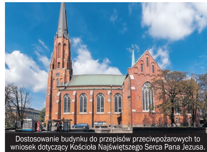
Dostosowanie budynku do przepisów przeciwpożarowych to wniosek dotyczący Kościoła Najświętszego Serca Pana Jezusa.