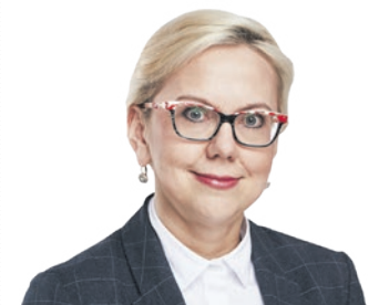
ANNA MOSKWA, minister Klimatu i Środowiska:

Celem rządowego programu jest zbudowanie 67,6 tys. przydomowych instalacji retencyjnych i zagospodarowanie wody opadowej i roztopowej w ilości 3,38 mln m 3 rocznie.