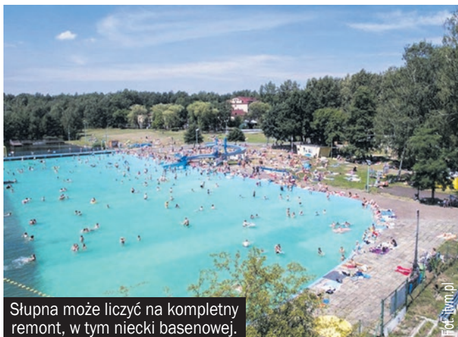
Słupna może liczyć na kompletny remont, w tym niecki basenowej.

Sfinansowano ze środków miasta Mysłowice