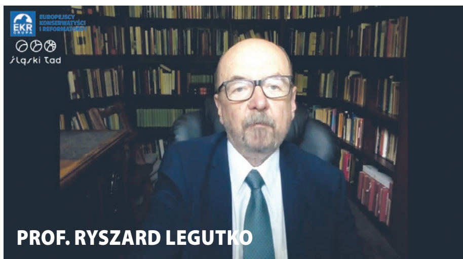
PROF. RYSZARD LEGUTKO

Jesteśmy na progu ogromnej transformacji i wspólna wizja przyszłości napawa optymizmem, ale to nie znaczy, że powinniśmy być zadowoleni. Ryzyko zawsze istnieje. Przekształcenie obecnego systemu oznacza radzenie sobie ze starymi zagrożeniami i napotykanie po drodze nowych. Regiony o kręgosłupie przemysłowym, takie jak Śląsk, są dobrze przygotowane do wykorzystania swojej wiedzy, gospodarki i potencjału, aby przejść z tradycyjnej energii na czystą.