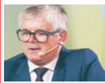
ADAM GAWĘDA, poseł na Sejm RP

Trójmorze jest obecnie najszybciej rozwijającym się regionem na świecie i musimy dobrze wykorzystać ten potencjał. Swoją aktywność inwestycyjną Fundusz koncentruje na trzech obszarach: transport, infrastruktura transportowa i energetyczna.