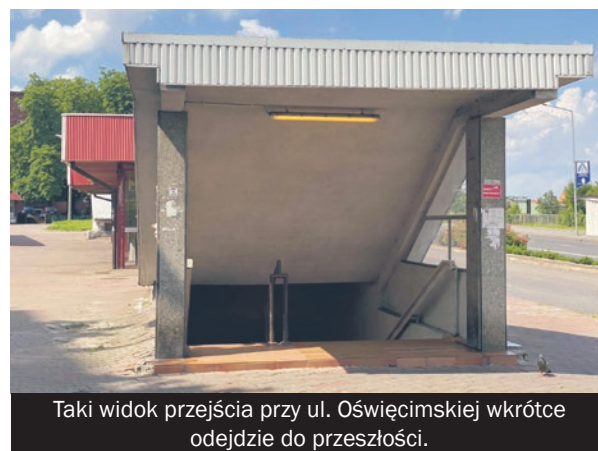
Taki widok przejścia przy ul. Oświęcimskiej wkrótce odejdzie do przeszłości.

Po pierwsze przebudowane zostanie przejście podziemne pod dworcem przy ul. Oświę-