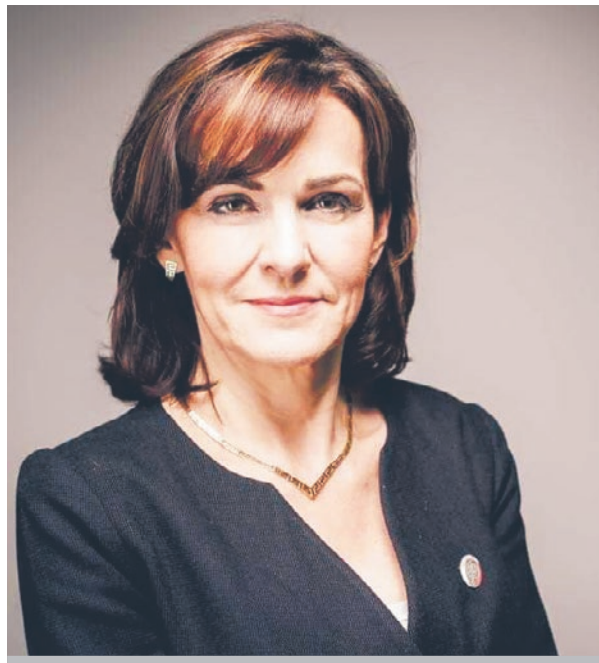
Gabriela Morawska-Stanecka, wicemarszałek Senatu

Od ubiegłego tygodnia przedstawiciele rządu przekonują w mediach o konieczności wypowiedzenia Konwencji Stambulskiej. Uruchomiło to na nowo kobiety, które po raz kolejny wychodzą na ulice polskich miast i miasteczek w obronie swoich praw. Taki protest miał miejsce również w Katowicach. Kobiety z różnych środowisk zebrały się na Rynku, aby wyrazić swój sprzeciw wobec zamiarów rządu. Sprzeciw czynny, polegający na uświadomieniu odbiorcom, czym tak naprawdę jest Konwencja. Kobiety czytały je postanowienia. Szczególnie przemówiło do mnie wystąpienie 13-letniej dziewczynki, która wypowiedziała się na temat artykułu 14 - dotyczącego edu-