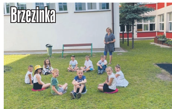
Kompleks rekreacyjno - terapeutyczny przy Szkole Podstawowej nr 10.