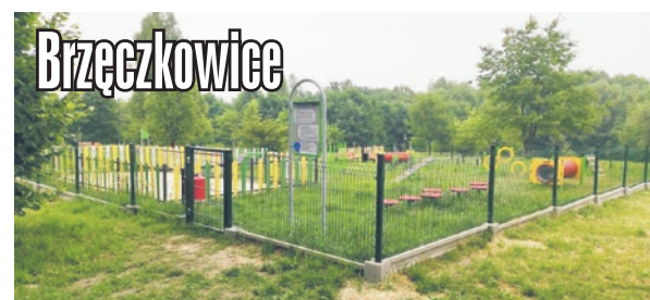
Psi wybieg na Górze Słupskiej. Znalazły się tu m.in. kładki, tunele i platformy do przechodzenia czy obręcze do skakania. Dla właścicieli są też ławki oraz kosze na śmieci i psie odchody z przypomnieniem, że po pupulu należy posprzątać. Przy wejściu stanął regulamin korzystania z wybiegu.