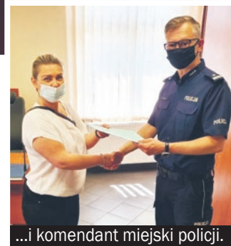
...i komendant miejski policji.

błyskawicznej i nieocenionej reakcji mężczyznę udało się zatrzymać, gdy wsiadał już z odebranymi od seniorki pieniędzmi do taksówki.