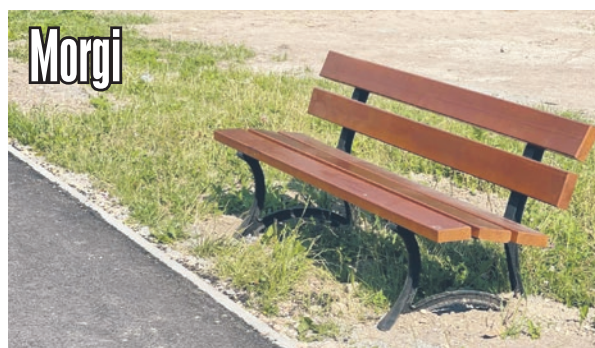
Alejki spacerowe przy placu zabaw (trzeba jeszcze uporządkować tereny zielone wokół alejki i uzupełnić nawierzchnię bitumiczną).