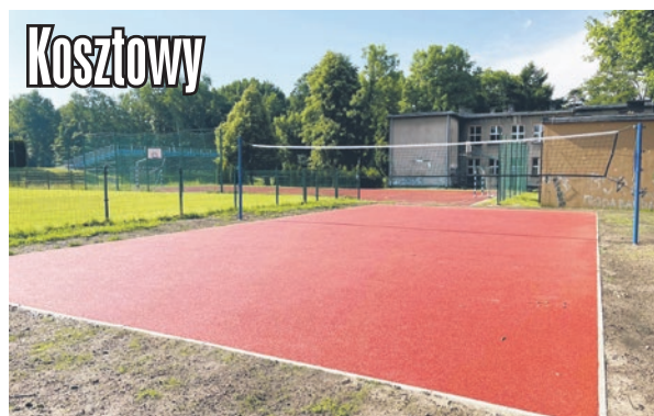
Boisko szkolne do gry w siatkówkę (brakuje jeszcze tylko linii obrysowujących).