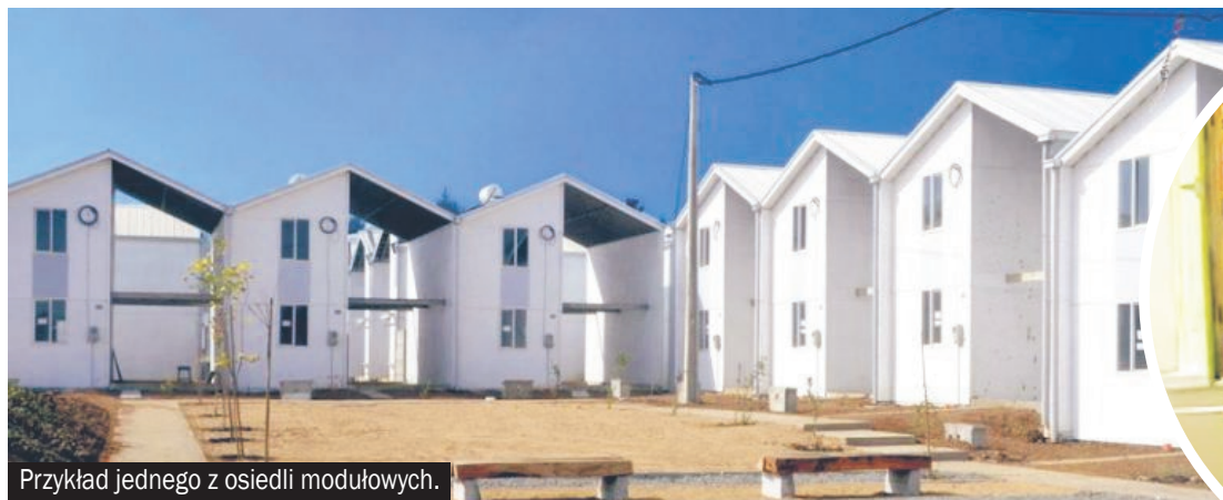
Przykład jednego z osiedli modułowych.