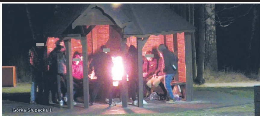
Górka Słupecka 1

i wyżyli się na wiacie grillowej zmodernizowanej niedawno przez Zakład Oczyszczania Miasta Mysłowice. Palenisko zostało kompletnie zniszczone, a wstępny koszt dewastacji oszacowano na 10 tys. zł. Kiedy młodzi wandale „bawili się” w najlepsze chyba nie przypuszczali, że właśnie idą po nich strażnicy miejscy. Akcja została przeprowadzona modelowo. Chłopcy próbowali zbiec, ale interweniujący funkcjonariusze doskonale znali miasto i przewidzieli możliwe drogi ucieczki. Prowadzyc zająścia trafił w ręce policji. On i jego kompani muszą się teraz przygotować na nieprzyjemne chwile. Nawet najlepszy obrońca nie uchroni ich przed odpowiedzialnością, ponieważ monitoring miejski uchwycił i zapisał przebieg dewastacji.