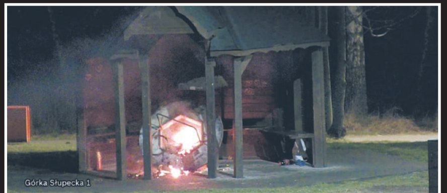
Górka Słupecka 1