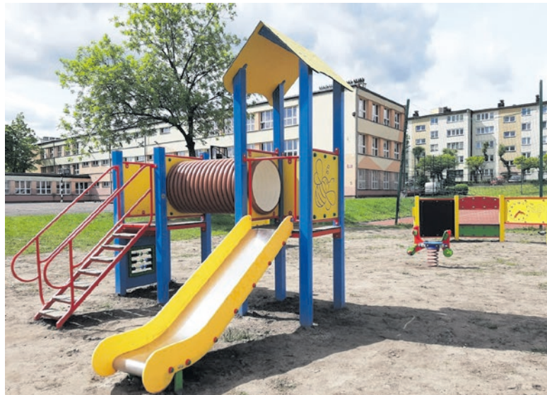
Strefa aktywnego wypoczynku rodziny przy Szkole Podstawowej nr 1 w Mysłowicach (realizacja 4. edycji MBO).

W głosowaniu wzięło udział 4312 osób, z czego 3770 oddanych głosów uznano za ważne. Najwięcej głosów