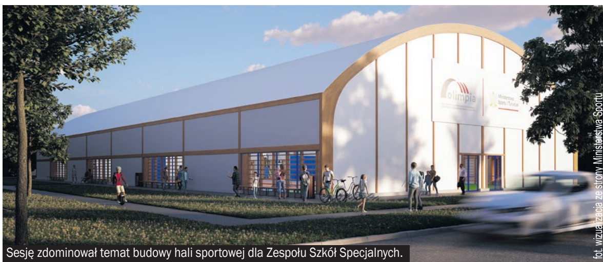
Sesję zdominował temat budowy hali sportowej dla Zespołu Szkół Specjalnych.