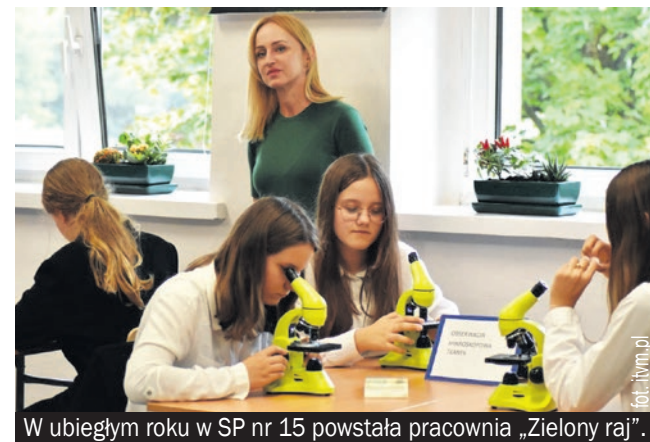
W ubiegłym roku w SP nr 15 powstała pracownia „Zielony raj”.