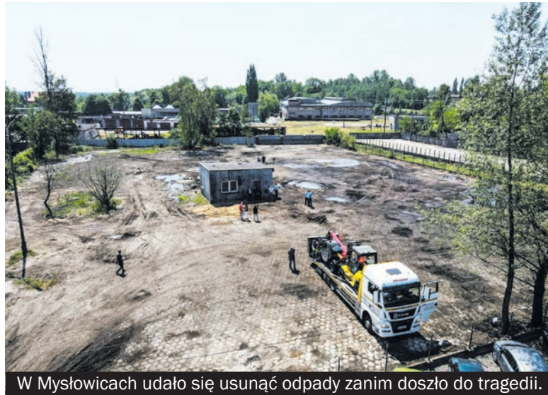
W Mysłowicach udało się usunąć odpady zanim doszło do tragedii.

Zintensyfikowane zostały działania kontrolne przedsiębiorców, którzy zajmują się gospodarką odpadami jak również miejsc, co do których istnieje podejrzenie prowadzenia nielegalnej działalno-