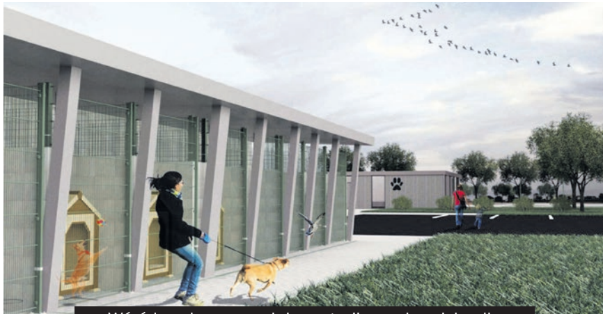
Wśród zaplanowanych inwestycji są schronisko dla bezdomnych zwierząt i modernizacja kąpieliska Słupna.