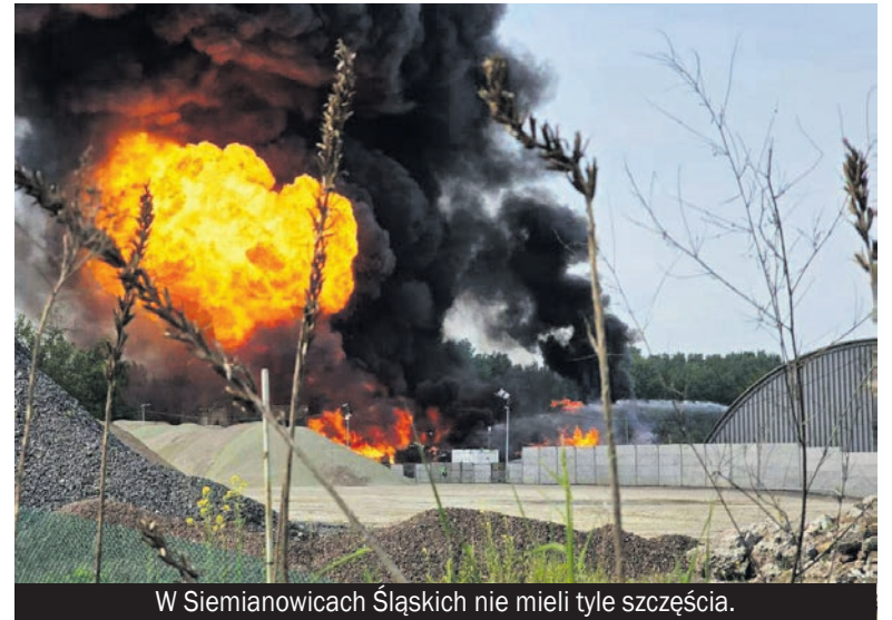
W Siemianowicach Śląskich nie mieli tyle szczęścia.

Odpady niebezpieczne zgromadzone zostały nielegalnie - bez żadnej zgody Prezydenta Miasta, a nawet bez wiedzy właściciela nieruchomości - nie tak jak w 2018 r., kiedy to zgodę na zbieranie odpadów niebezpiecznych przy ul. Brzezińskiej wyraził z upoważnienia Prezydenta ówczesny naczelnik Wydziału Ochrony Środowiska. Jeszcze w 2021 r. wydano decyzję nakazującą usunięcie odpadów z hali. Obecnie trwa postępowanie egzekucyjne w tej sprawie.