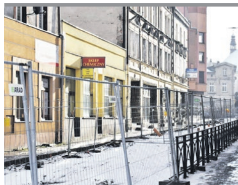
Za pięć miesięcy tramwaje wrócą na tory.