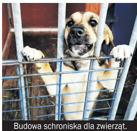
Budowa schroniska dla zwierząt.