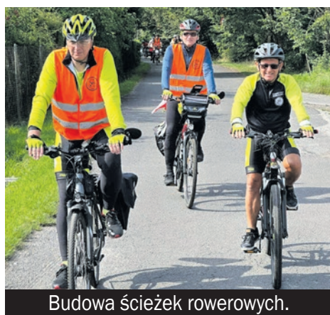
Budowa ścieżek rowerowych.