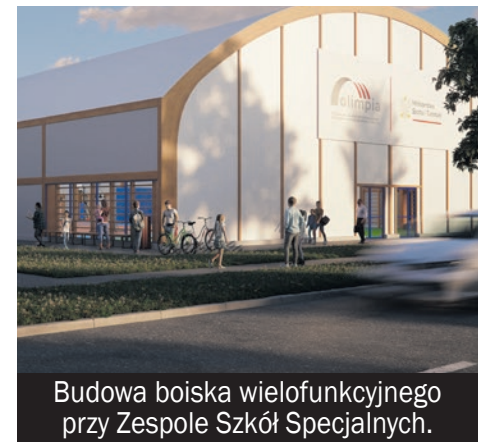
Budowa boiska wielofunkcyjnego przy Zespole Szkół Specjalnych.