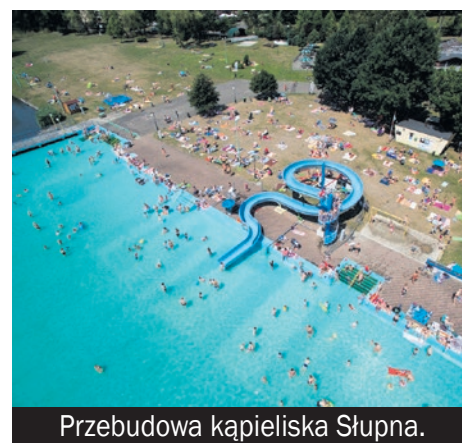
Przebudowa kąpieliska Słupna.