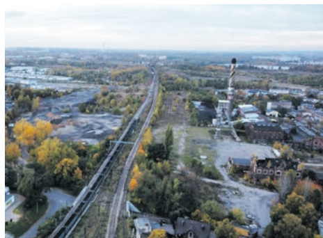
Aktywizacja terenów po kopalni Mysłowice (ulica Świerczyny, ulica Boliny).

W związku z nieuchwaleniem budżetu przez radnych, realizacja tych inwestycji stanęła pod znakiem zapytania.