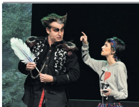
„Igraszki z diabłem” wracają na afisz!