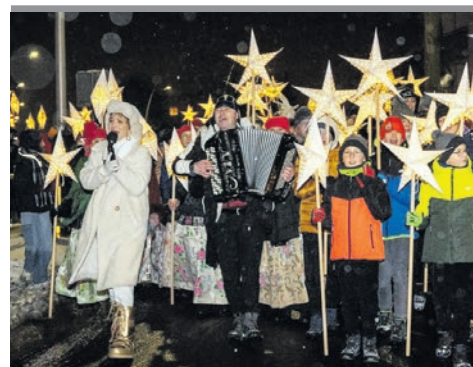
Wesołe kolędowanie z Wyrostkiem i Steczkowską.