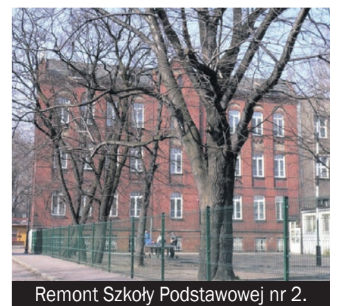
Remont Szkoły Podstawowej nr 2.